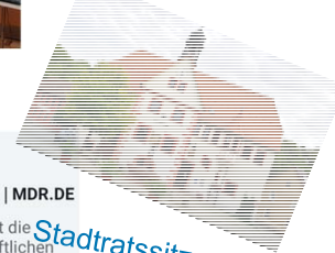
Stadtratssitzung Rastenberg 21.08.2019