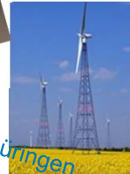
MDR.DE Flaute im Windpark – Energiewende in Gefahr | MDR.DE "Exakt - Die Story" nimmt die wachsenden gesellschaftlichen Konflikte rund um die Windenergie in den Blick und fragt nach, was deren Zuspitzung für die Energiewende in Thüringen bede...