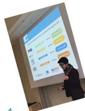
Agrarworkshop Nordthüringen 31.01.2019