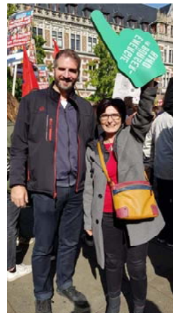
Fraturdays for Future 20.09.2019 Erfurt