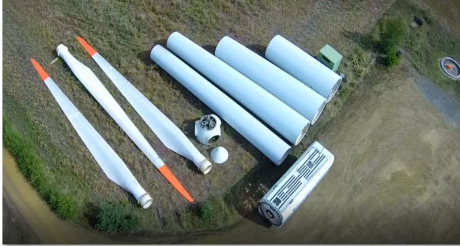
Demontage Vestas V66-780m NH