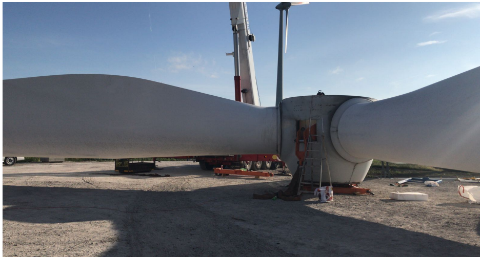
Gestell zur Montage und Demontage für die Nabe