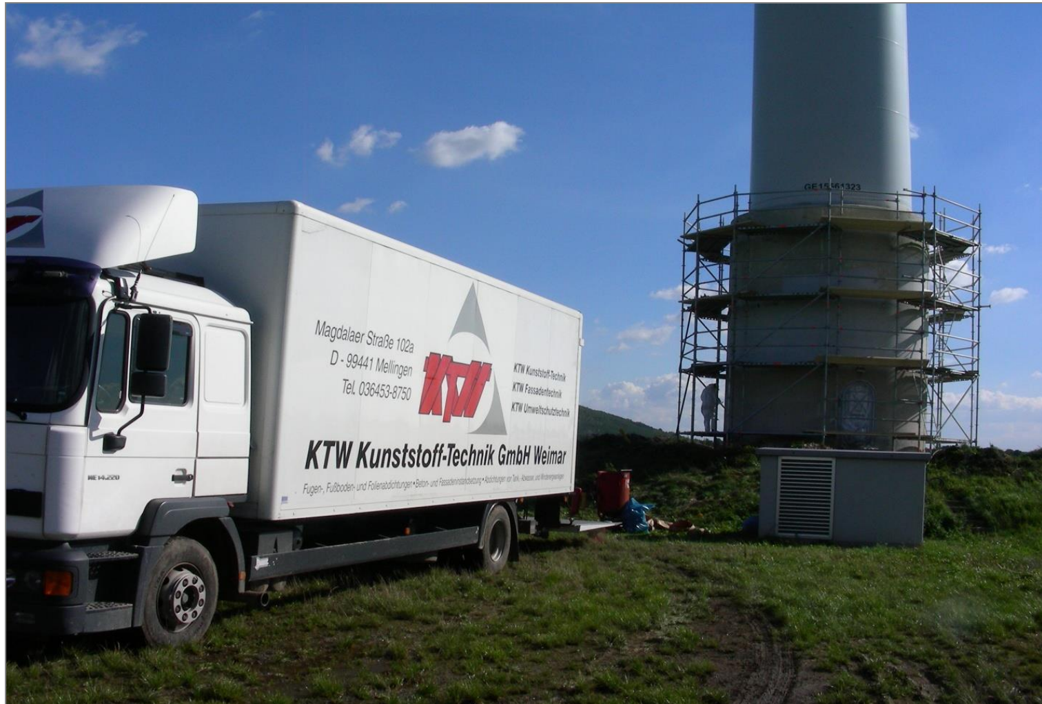
Hochelastische Abdichtungen für Windenergiefundamente