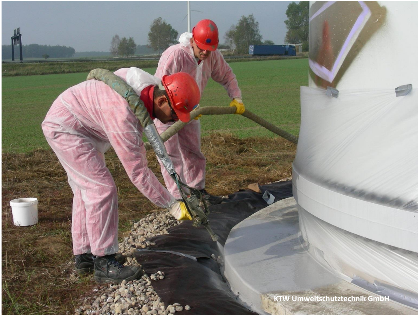
Sanierung von Sockelfundamenten mit hochelastischer Polyurethan-Abdichtung