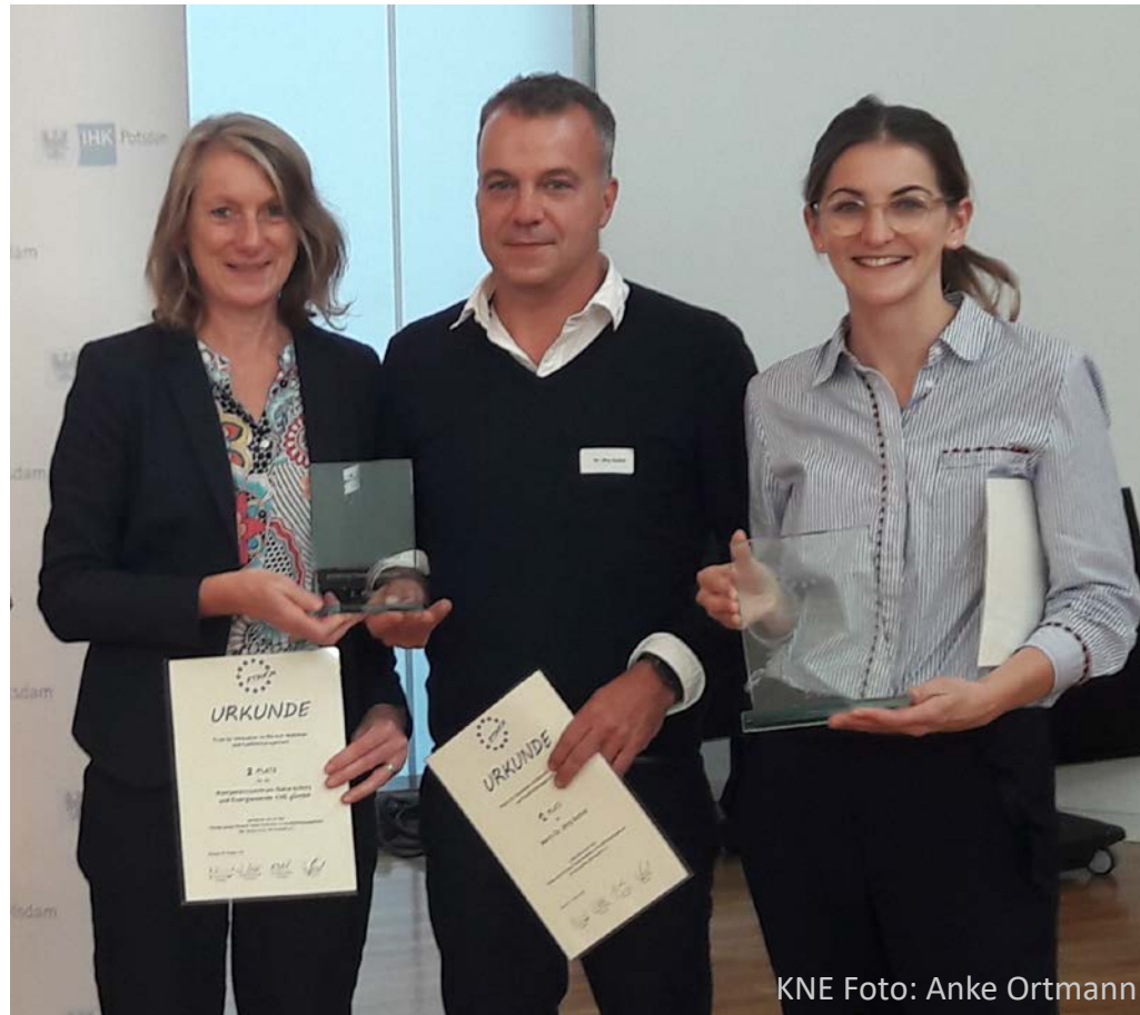
KNE Foto: Anke Ortmann

„herausragendes deutschlandweites Engagement in einem politisch und gesellschaftlich sehr sensiblen und brisanten Themenbereich“.