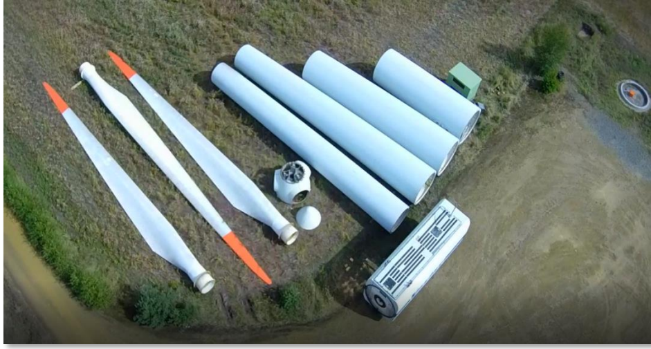
Demontage Vestas V66-780m NH