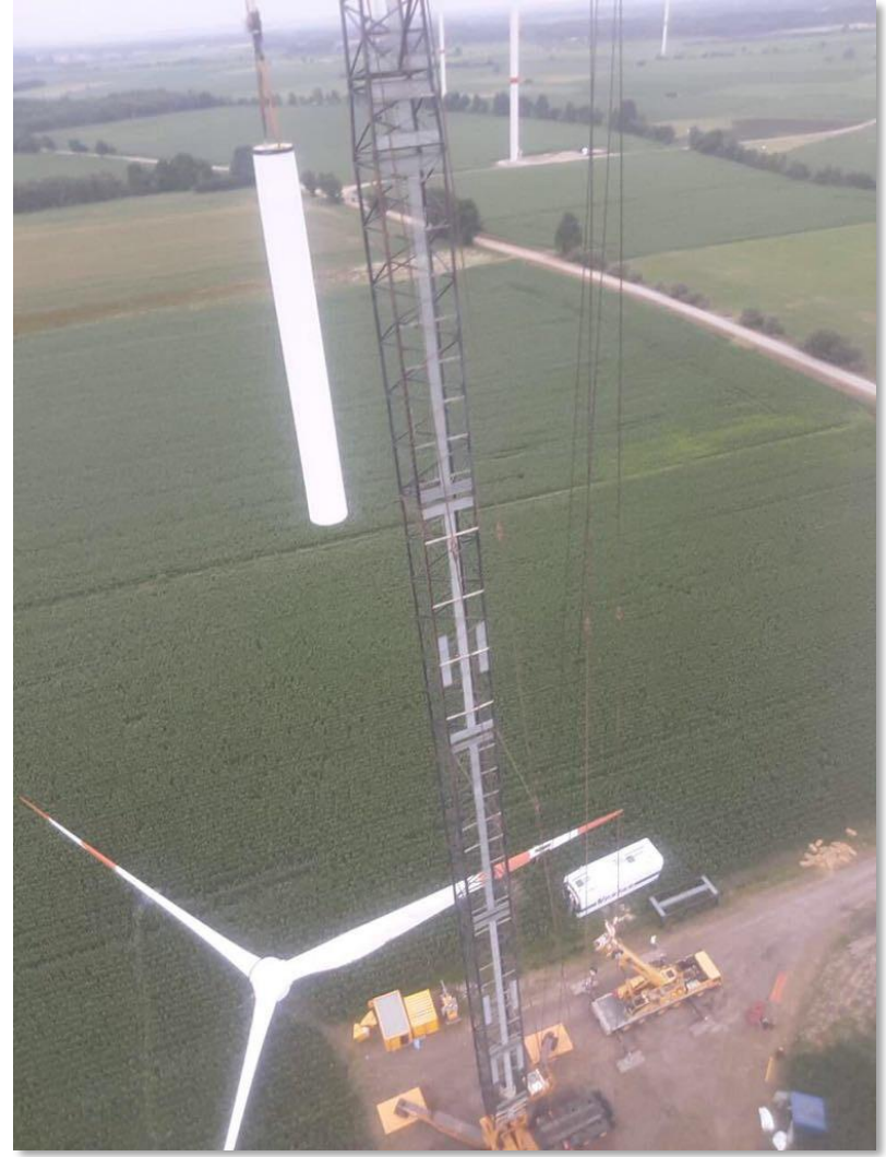
Demontage Vestas V80-100m NH