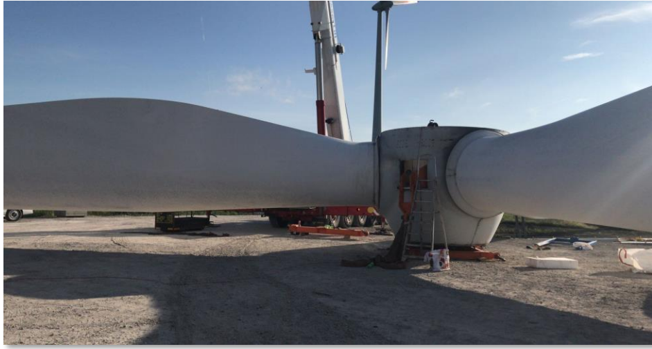
Gestell zur Montage und Demontage für die Nabe